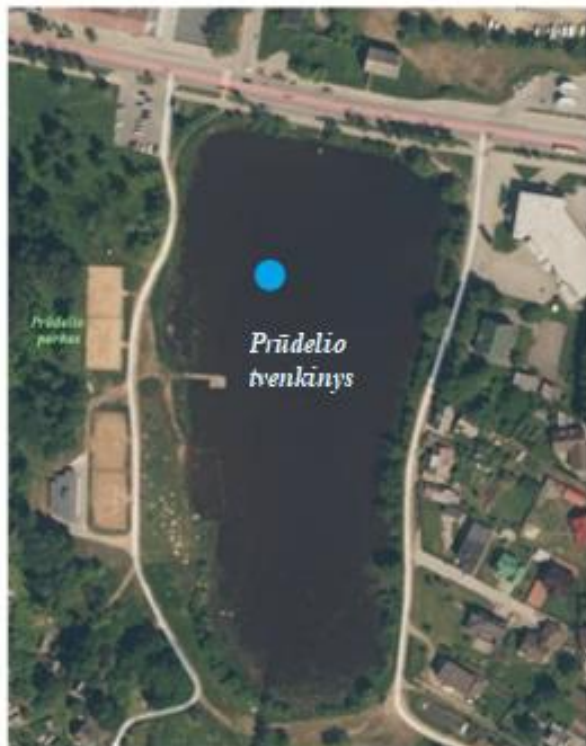
1 pav. Ledo storio ir deguonies koncentracijos matavimų vietos Šiaulių miesto paviršiniuose vandens telkiniuose 2023 m.